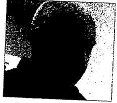
Dar, e bine când cheltui miliarde și te lauzi, era să scriem lauri, că ai câștigat șase sute de milioane. Tăman ca pe vremea noastră, a comuniștilor lăudăroși.

de ocupare a sălilor de la Teatrele Național, Comedie, Mic, Nottara și Odeon este de 97%. De la Laurian Oniga, directorul Teatrului Clasic „Ioan Slavici” din Arad, am aflat că festivalul de teatru clasic s-a încheiat duminică și a încasat suma de 600.000.000 de lei vechi, 60.000 RON. Și am mai aflat că e un fel de record, că teatrul din Timișoara la un festival asemănător n-a încasat atât de