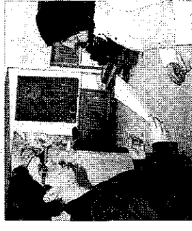
Luni - premiere

proiectului „Antreprenori-atul și egalitatea de șanse. Un model inter-regional de școală antreprenorială pentru femei". Planurile de afaceri au fost întocmite de grupurile țintă I și II ale proiectului (femei manager și femei care doresc să-și inițieze propria afacere), din cele patru Centre locale AntrES, care au fost instruite gratuit în cadrul Școlii antreprenoriale AntrES, în perioada 5 ianuarie - 30 iunie.