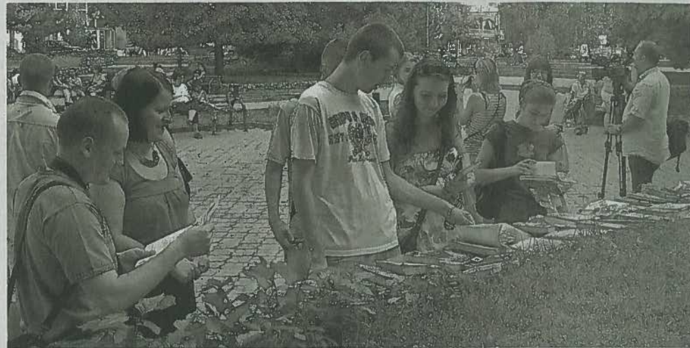
Amatorii de lectură au găsit titluri noi

De la manuale de limba română sau franceză și până la povești nemuritoare, romane polițiste, SF sau de dragoste.